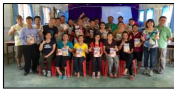
AES untuk STP Belaga (30) dan STP Long Lama (20)