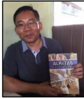
AES untuk MEC Miri (39) dan Anglikan Miri (30)

Dengan peluang yang masih terbuka untuk Sabah dan Sarawak, kami mempunyai 2,000 naskah Alkitab Edisi Pengajian dari LAI yang sedia untuk dibawa masuk melalui "Inisiatif Titus 2:7". Itu harus dilakukan dengan pantas. RM 200,000 diperlukan untuk merealisasikan ini. Kami mempercayai Tuhan untuk menyediakan wang tersebut sebelum akhir bulan Ogos.