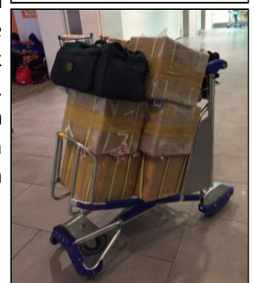
Dibawa dengan tangan ke Semenanjung